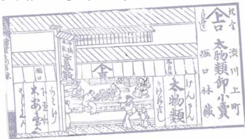
天保10年頃発行の三国街道「諸業高名録」より。 上之町北側掘口家は現存する唯一の典型的な町屋づくり